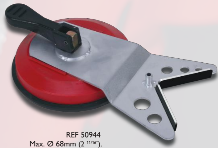
REF 50944 Max. Ø 68mm (2 11/16").

GUIA MULTIDRILL | MULTIDRILL GUIDE | GUIDE MULTIDRILL | GUIA MULTIDRILL | GUIDA MULTIDRILL | MULTIDRILL-SCHIENE | MULTIDRILL GELEIDING | PROWADNICA UNIWERSALNA | НАПРАВЛЯЮЩАЯ МУКТИДРИЛЛ | MULTIBORE GUIDE | MONIKÄYTTÖPORAOHJAIN | VODÍTKO MULTIDRILL | SISTEM DE GHIDARE "MULTIDRILL" | 多钻头定位器 |